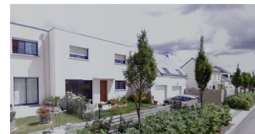
Maisons individuelles – lots libres Allée Schubert, Chantepie (35) ZAC des Rives du Blosne