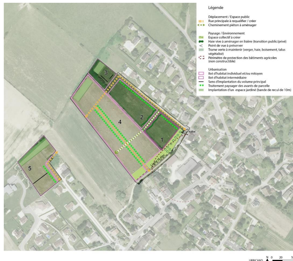
Schéma d'organisation du quartier à long terme (illustration)