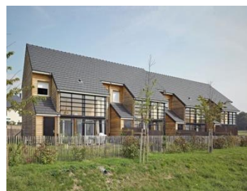
Maisons mitoyennes Petitville (76) Atelier 6.24 architectes