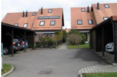
Créer une placette mutualisée aux parcelles - Echallennes (25)