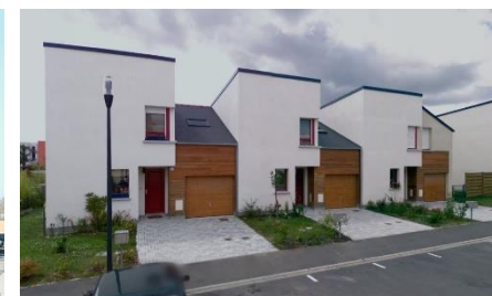
Traitement du retrait Allée Schubert, Chantepie (35) ZAC des Rives du Blosne