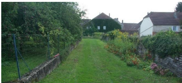
Cheminement piéton entre propriétés privées - Vriange (39)