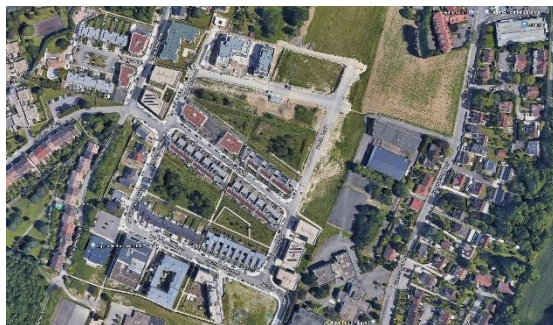
ZAC du Moulin, Saulx-les-Chartreux, (91) AUA Paul Chemetov