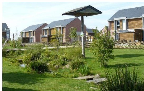
L'EcoQuartier des Arondes à Roncherolles-sur-le-Vivier (Seine-Maritime), (76)