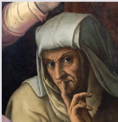
Genre de Andrea del Sarto, Tête de femme, le Silence (milieu du XVI e siècle), dét.

200 ans après la naissance du musée de Dole en 1821, comment rassembler deux siècles d'existence ? C'est en partant des figures d'hommes et de femmes qui ont fait le musée depuis 1821 que nous écrivons cette histoire : avec les fondateurs, les directeurs et directrices successifs, les édiles qui ont accompagné ces 200 ans. L'histoire de notre musée, ce sont aussi les différents lieux qu'il a investis, la constitution des collections, les grandes expositions et les artistes qui l'ont animé. Tout cela dessine, dans un parcours alliant chronologie et approches thématiques, une histoire du goût, de la muséographie, qui dépasse le contexte d'aujourd'hui pour s'inscrire dans la plus large histoire des musées depuis le 19 e siècle.