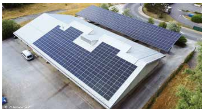
● Site de la base nautique d'aviron et canoë-kayak

À terme, ces installations photovoltaïques mises en service en juillet dernier produiront l'équivalent d'une année de consommation électrique de 460 habitants de la région doloise.