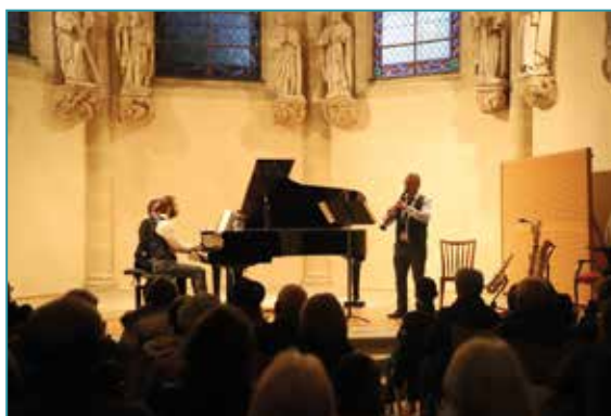
Des concerts chéris des Dolois.