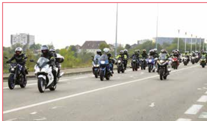
● Sur le pont de la Corniche, les motards offrent un show exceptionnel !

Pour rappel, la recette des inscriptions des motards (hors repas) est reversée intégralement à la recherche contre la mucoviscidose. L'année dernière, l'association a ainsi restitué 11 500 euros à cette cause, ainsi que 1 500 euros aux infirmières des Centres de Ressources et de Compétences pour la Mucoviscidose.