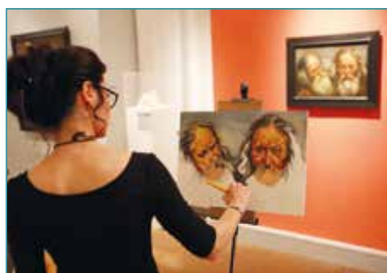
Nos amateurs ont du talent.