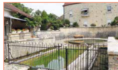
● La fontaine et le lavoir de Diane

Ce site, tout comme celui de l'église et de la motte féodale, bénéficiera prochainement de l'installation de panneaux de médiation réalisés par la Ville de Dole. Illustrés de photos anciennes et d'un descriptif de l'histoire de ces lieux, ils permettront aux futurs visiteurs et résidents de Goux de pouvoir découvrir et profiter du patrimoine remarquable de cette commune.