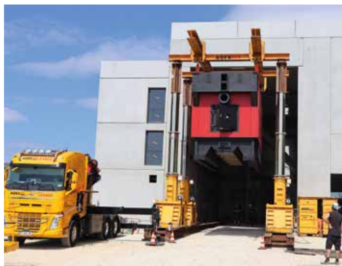
● Trois convois exceptionnels se sont succédé pour livrer le foyer principal, la chambre de combustion intermédiaire et l'échangeur.

À travers ce nouveau dispositif écologique et résolument plus économique, Dole poursuit sa transition environnementale en réduisant ses émissions de carbone et en permettant aux Dolois de bénéficier de chauffage et d'eau chaude sanitaire à coûts maîtrisés, tout en favorisant la filière bois locale, puisque les bois sont prélevés dans un rayon de 100 km autour de Dole.