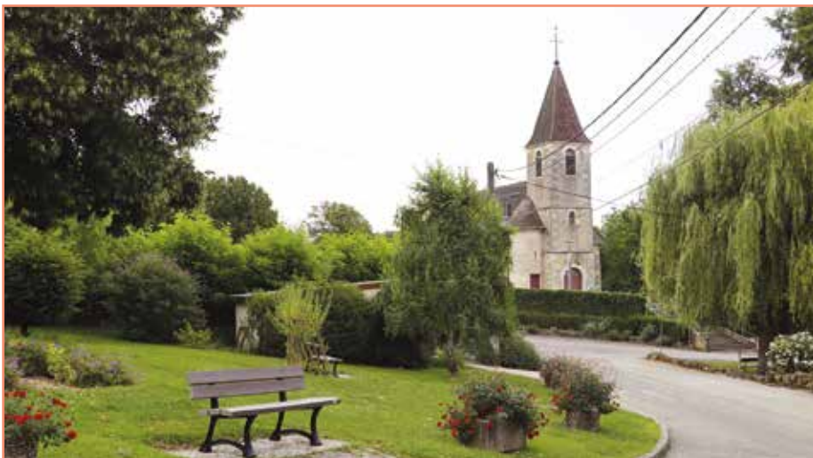
● Vue de l'église de Goux