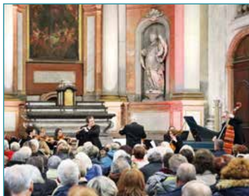
Les Dolois connaissent la partition.