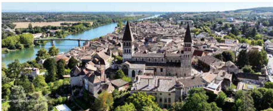
● Vue de la ville de Tournus

Le traditionnel Week-end Gourmand du Chat Perché revient pour sa 9 ème édition à Dole, du vendredi 29 septembre au dimanche 1 er octobre.