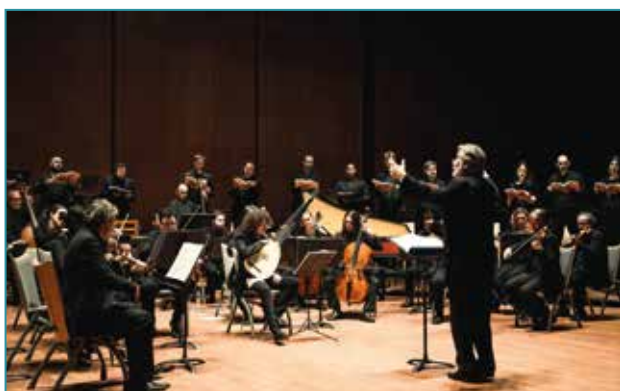
Orchestre des Nations de Jordi Savall, Orchestre Français des Jeunes, Orchestre Victor-Hugo Franche-Comté, Festival de Musique de Besançon, Ensemble Orchestral du Jura