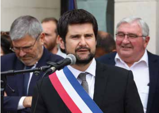
• Discours de soutien aux victimes, aux forces de l'ordre, aux pompiers et aux élus le 3 juillet dernier.