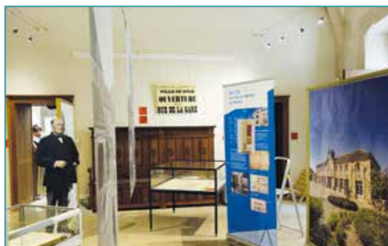
Du XVI ème siècle au XIX ème siècle, les expositions traversent les époques.