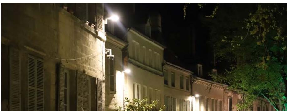
• Les éclairages Leds: plus économiques et plus respectueux de l'environnement.

La tranche de renouvellement de l'éclairage public, réalisée en 2021, concernait le remplacement de 113 luminaires par des éclairages Leds, avec une économie à la clef de 6493€ par an, dans le Centre-Ville. Ces économies permettront d'investir dans d'autres domaines.