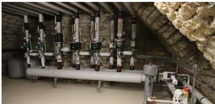
• La sous-station, une installation qui permettra de relier la Visitation au chauffage urbain.

Cet été, le bâtiment de la Visitation va dire adieu à ses six chaudières. À la place, un raccordement au chauffage urbain, pour un impact environnemental positif.