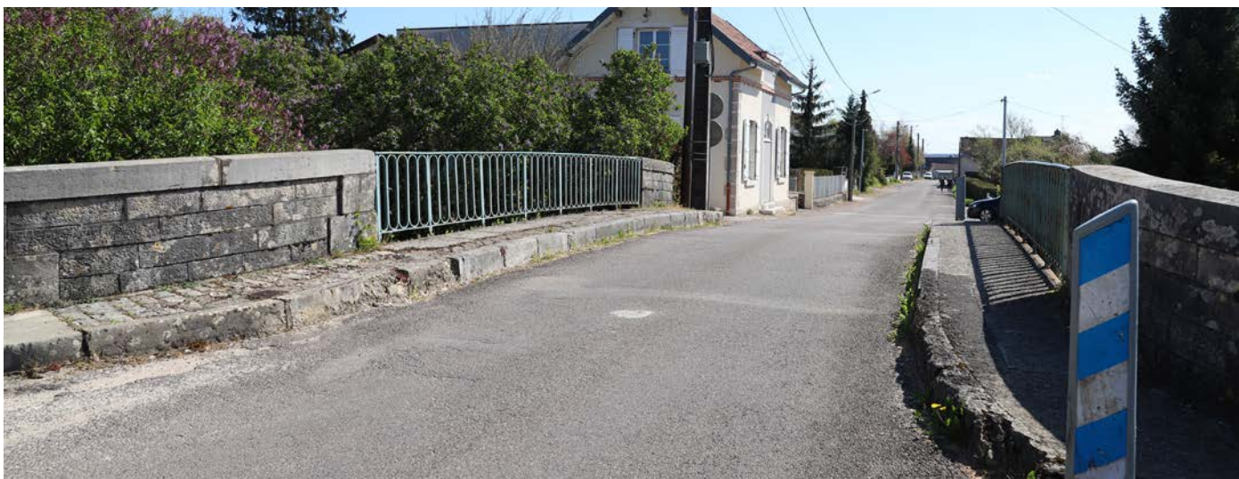
• Le pont des Commards va être rénové.

Les travaux de rénovation du pont des Commards vont débuter cet été. Dans un second temps, la rue va être requalifiée et repensée pour améliorer la sécurité et la tranquillité des riverains, grâce à de nouveaux aménagements qui réduiront notamment la vitesse des automobilistes.