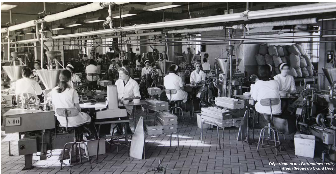
Département des Patrimoines écrits, Médiathèque du Grand Dole.

• Auparavant propriété des Frères Graf, l'usine de Dole a été rachetée par le groupe Bel en 1960.