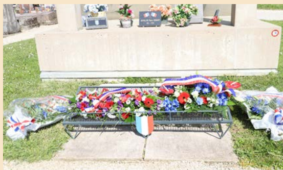
● Des gerbes ont été déposées devant la crypte