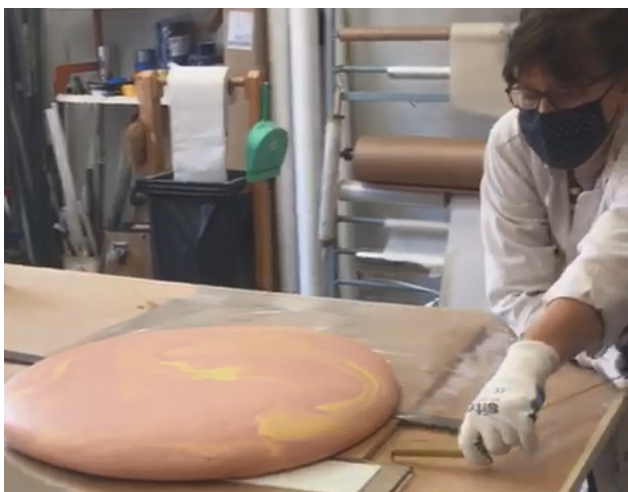
● Une restauratrice est intervenue au Musée afin de préserver cette œuvre originale.