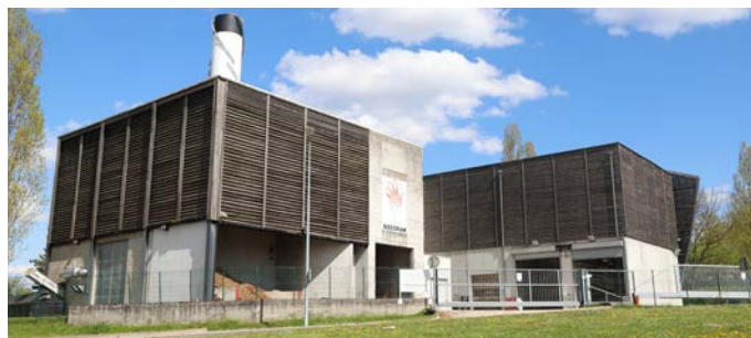
• Le réseau de chauffage de la SOCCRAM va bientôt alimenter la Visitation.

Les travaux de la Visitation s'insèrent dans un objectif de transition énergétique. En effet, le réseau urbain doit être alimenté à plus de 50% en énergie verte, là où les actuelles chaudières fonctionnent au gaz, une énergie fossile. « L'impact environnemental est positif » assure Fabien Marlet. On réduit l'empreinte carbone d'un bâtiment. Cet été, les 2300 m 2 du bâtiment de la Visitation se mettront donc au vert.