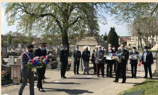
● Recueillement solennel en cette journée d'hommage