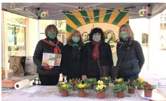
● L'opération a été un franc succès.

« Le Galet Mou », sculpture unique de 60 cm de diamètre réalisée par Michel Blazy à base de bonbons Krema, a été acquise en 2011 par le groupe Bel grâce au fonds de dotation Lab'Bel. Depuis 10 ans, la collection entière est d'ailleurs en dépôt au Musée des Beaux-Arts de Dole. Pour être conservé dans de bonnes conditions, hors périodes d'exposition, « Le Galet Mou », a bénéficié des soins d'une restauratrice spécialisée pour être entreposé dans une boîte en bois percée, de manière à ne pas souffrir de la chaleur et ne pas risquer les moisissures.